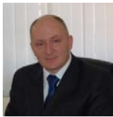
Хаутиев Шарпудин Маулиевич , Начальник управления по охране объектов культурного наследия администрации Губернатора Ульяновской области