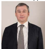
Рыжков Олег Владимирович , заместитель Министра культуры Российской Федерации