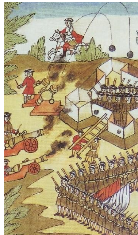
«Потешные полки Петра I под селом Кожуховым»

"Потешный" подход – это модуль для создания всех продуктов проекта и вовлечения целевых аудиторий (старшеклассников и студентов).