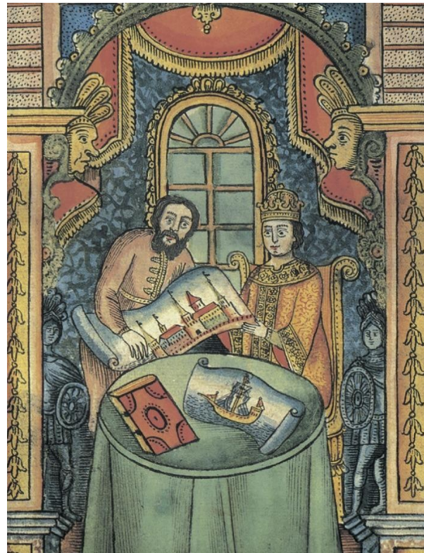
«Никита Зотов обучает Петра I разным наукам». Миниатюра из рукописи «История Петра I». 18 в.